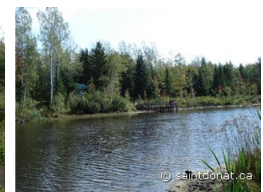
Sentier Au Bois Joli